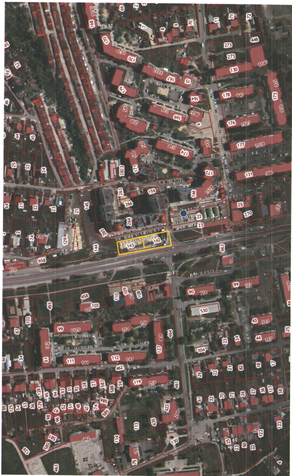
СХЕМА РАСПОЛОЖЕНИЯ ЗЕМЕЛЬНОГО УЧАСТКА НА КАДАСТРОВИМ ПЛАНЕ ТЕРРИТОРИИ